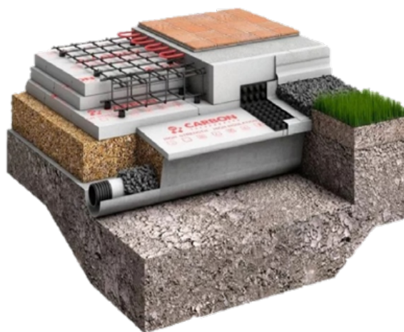
ТН-ПОЛ Термо, ТН-ФУНДАМЕНТ Плита УШП

Системы электрического отопления преобразуют электроэнергию в тепло. Они состоят из нагревательных элементов, питания и терморегулятора для контроля расхода энергии и поддержания определенной температуры.