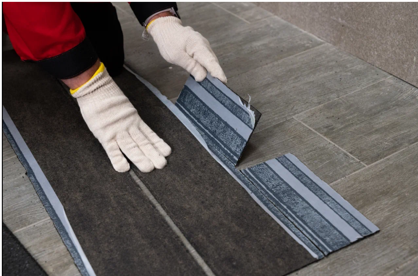
Стартовый ряд монтируется на 8 саморезов