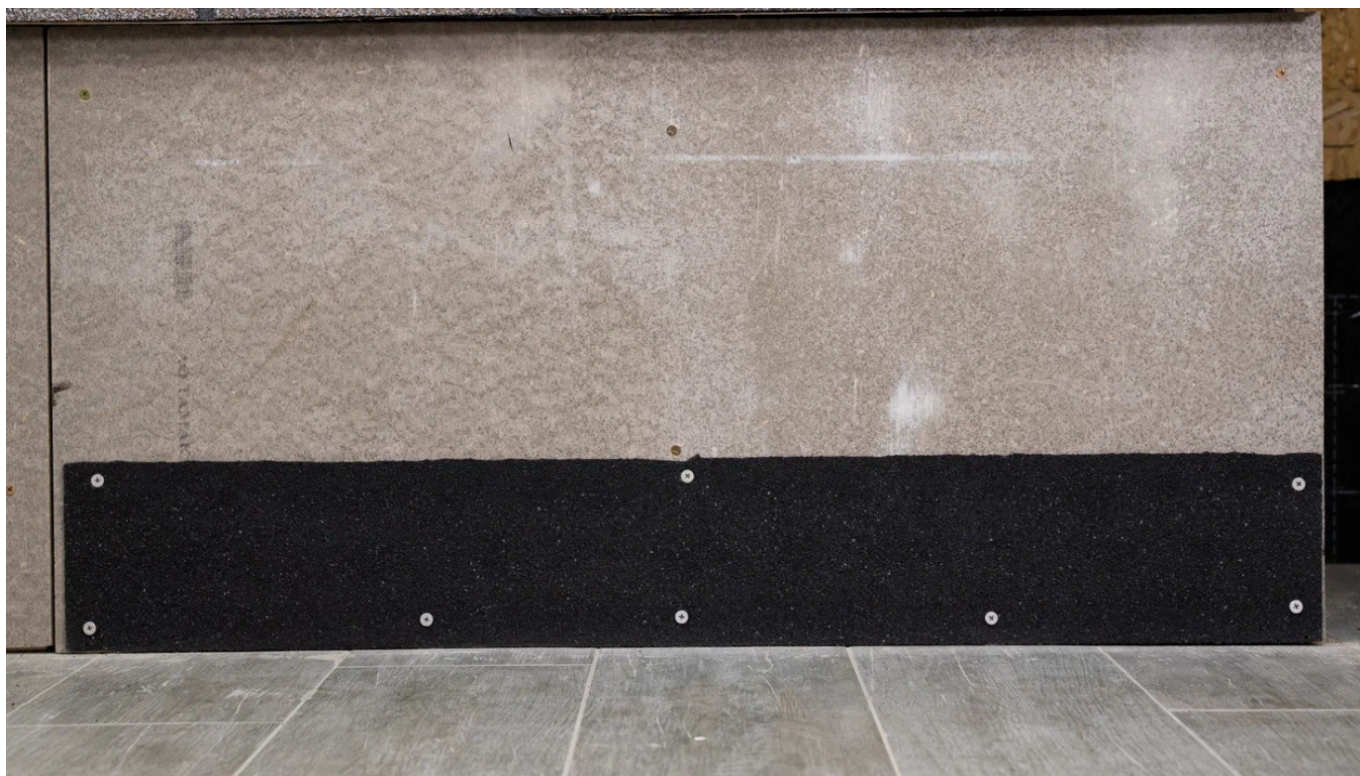
Первый ряд монтируется со смещением на половину лепестка. Каждая плитка фиксируется на 5 гвоздей