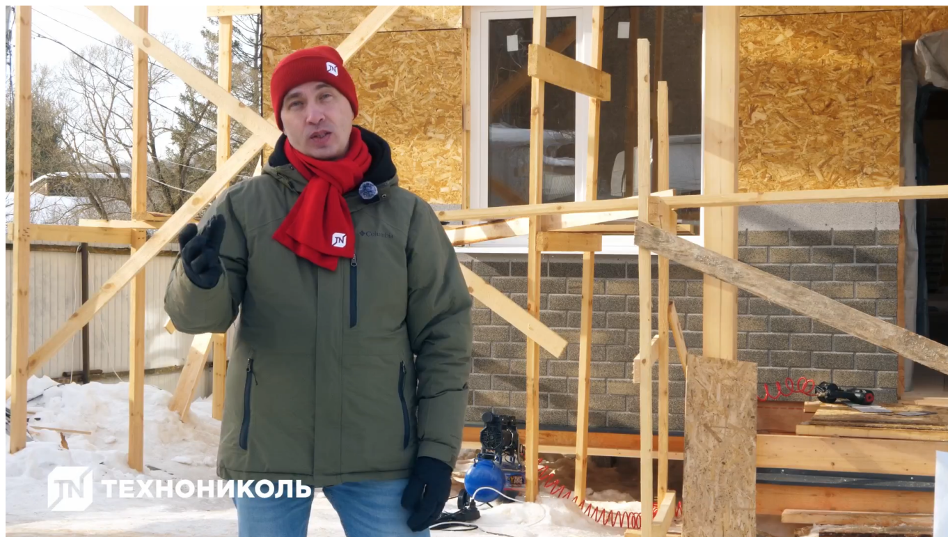
Монтаж фасадной плитки на деревянные основания, смотреть!