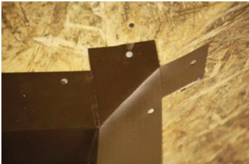
Крепление карнизной планки в ребре.