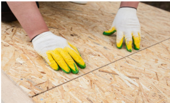
Укладка ОСП с зазором 3-5 мм

Подробный альбом технических решений по системе ТН-Шингласс Мансарда PIR можно скачать по ссылке (в том числе и редактируемом формате DWG), а так же найти справочную и техническую информацию по материалам). Ссылка ЗДЕСЬ