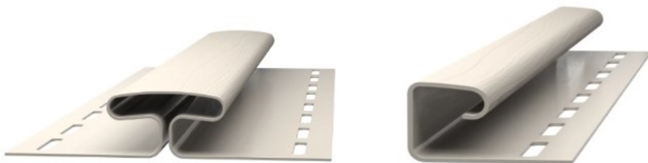
Н-профиль и J-профили для соединения панелей сайдинга