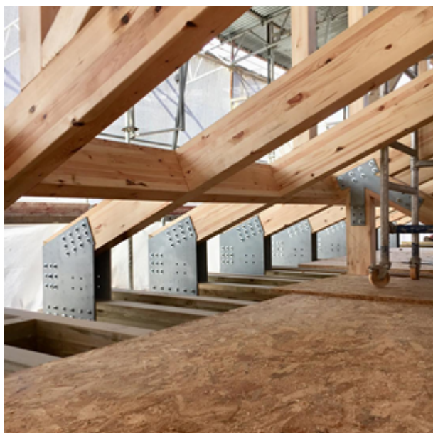
Деревянные несущие основания