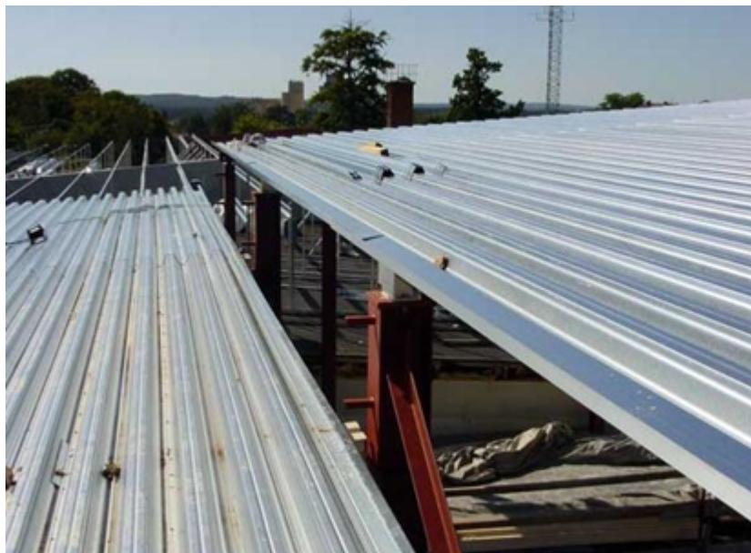
Профилированные стальные настилы