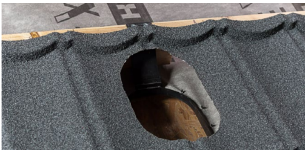
Проходной элемент (DECRA) для панели Classic

Для организации выходов на кровлю вентиляционных систем и вентиляции подкровельного пространства рекомендуем применять специальные кровельные аксессуары, которые поставляются в комплекте.