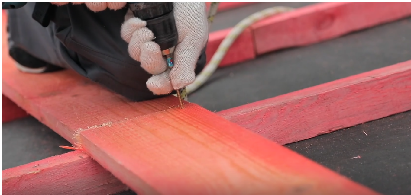
Серия 6: Подготовка сплошного основания