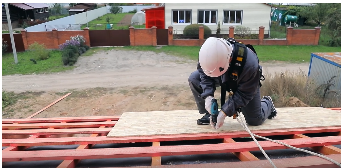
Серия 7: Усиление карнизного свеса