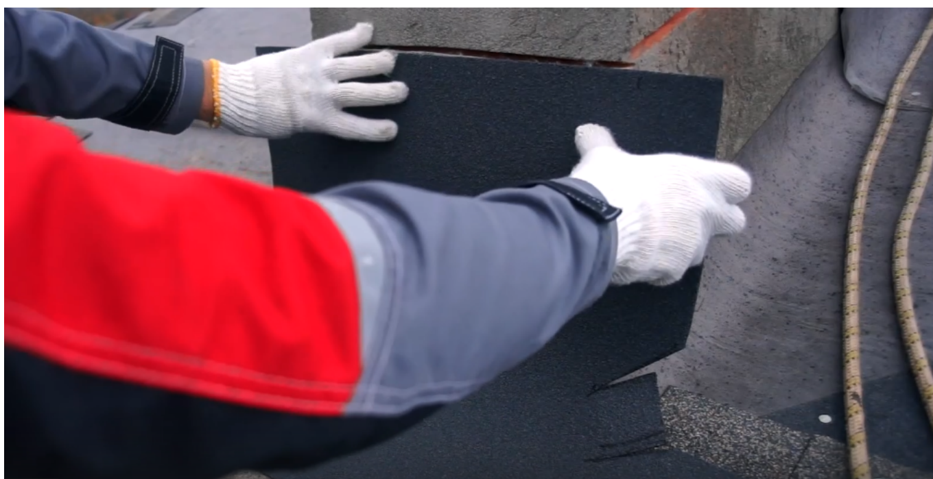
Серия 13: Кровельные проходки: вентиляция, антенна, труба, коммуникации