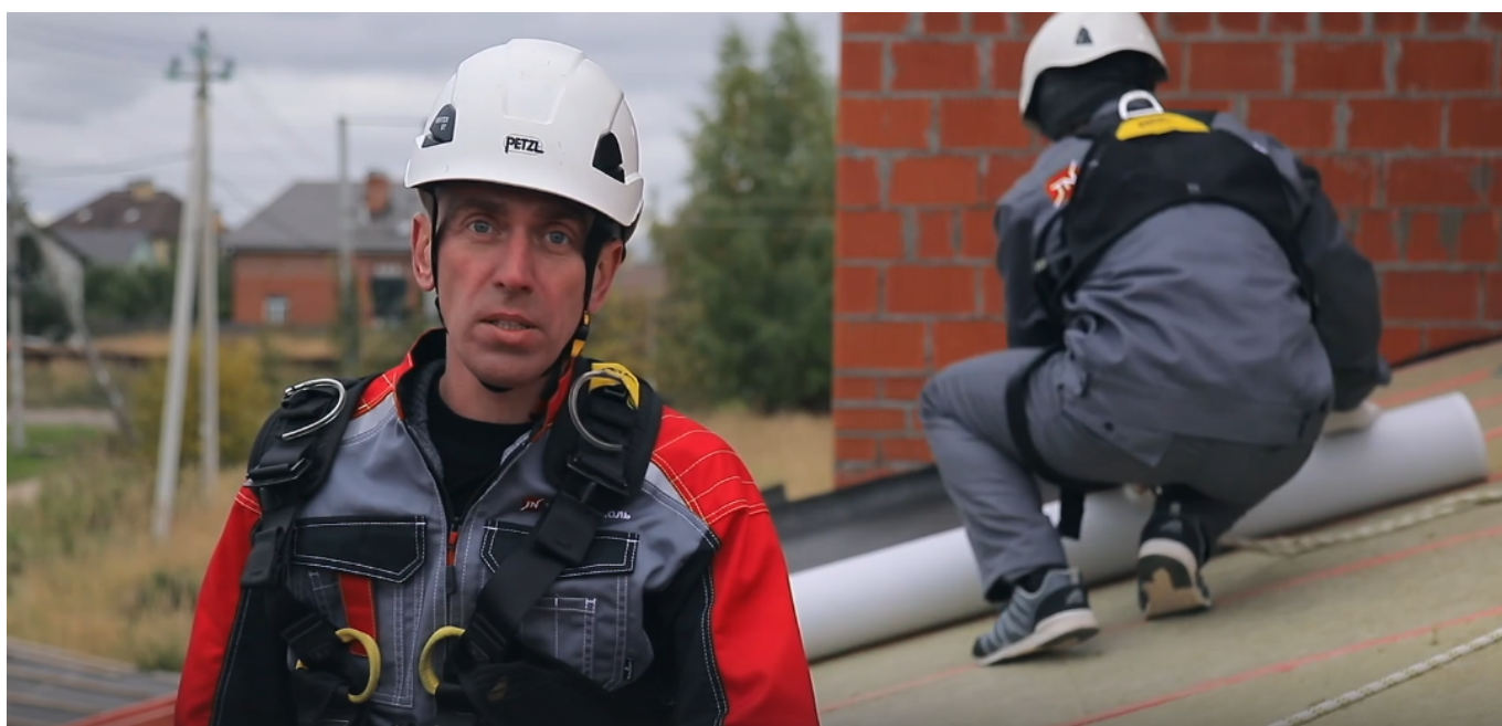
Серия 5: Вентиляция крыши (подкровельная): монтаж обрешетки