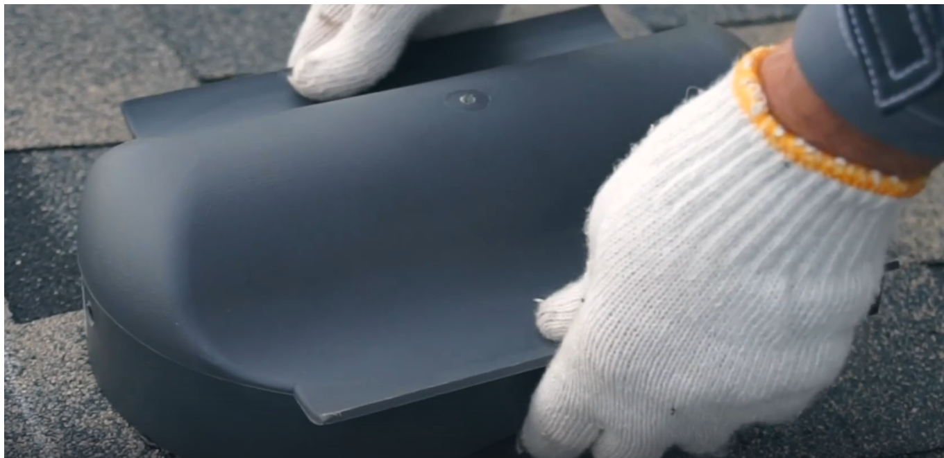
Серия 14: Оформление коньков и ребер скатной крыши