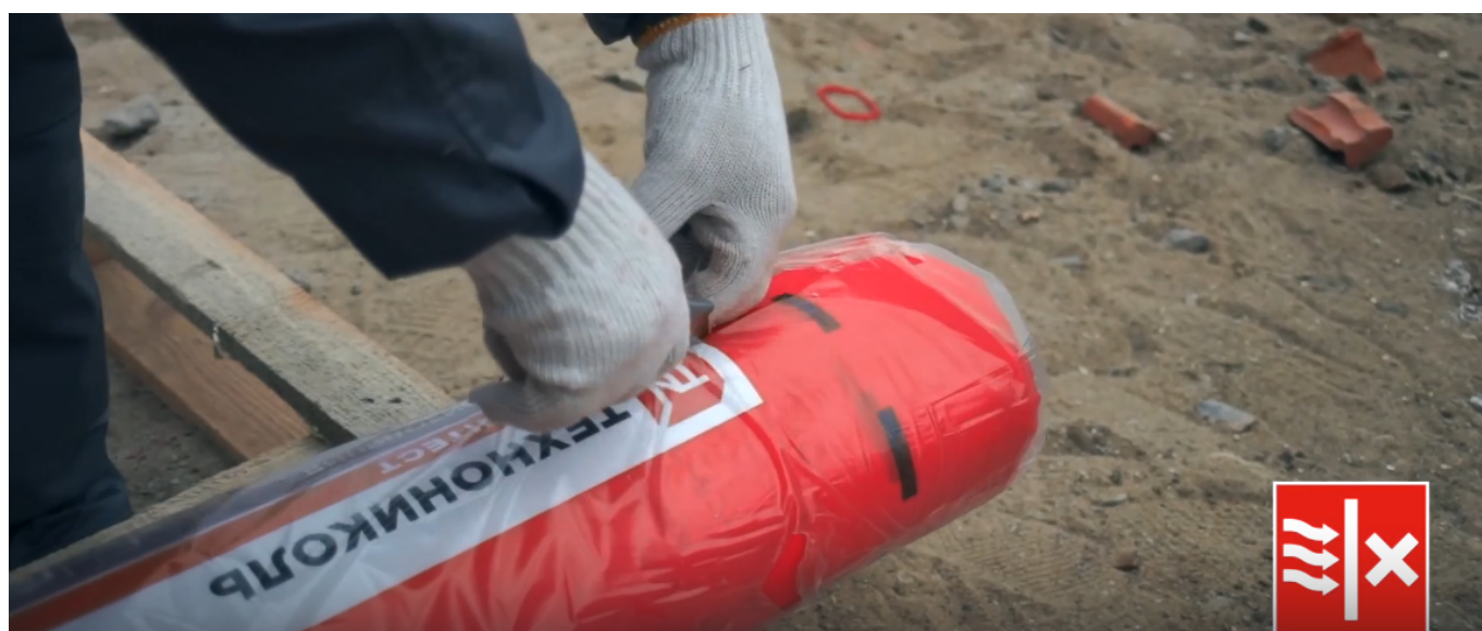
Серия 3: Теплоизоляция крыши: монтаж утеплителя