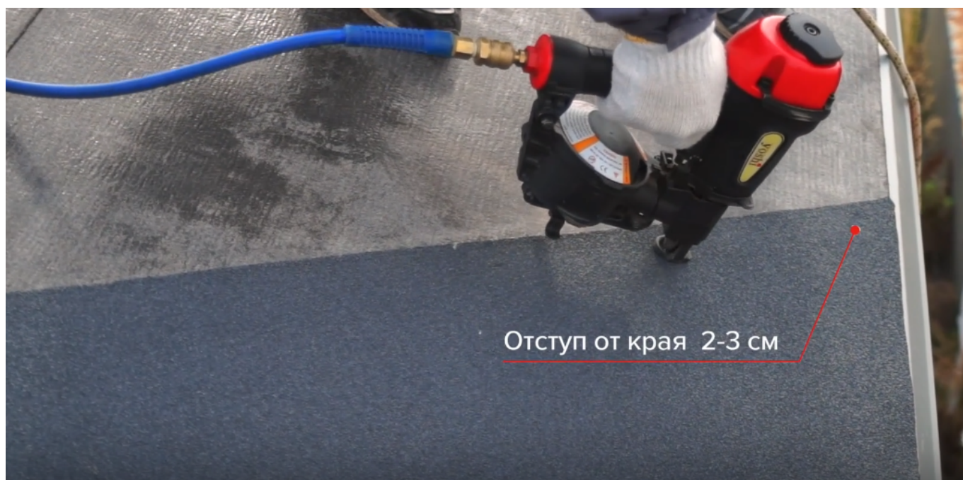
Серия 11: Устройство ендовы: метод «подреза»