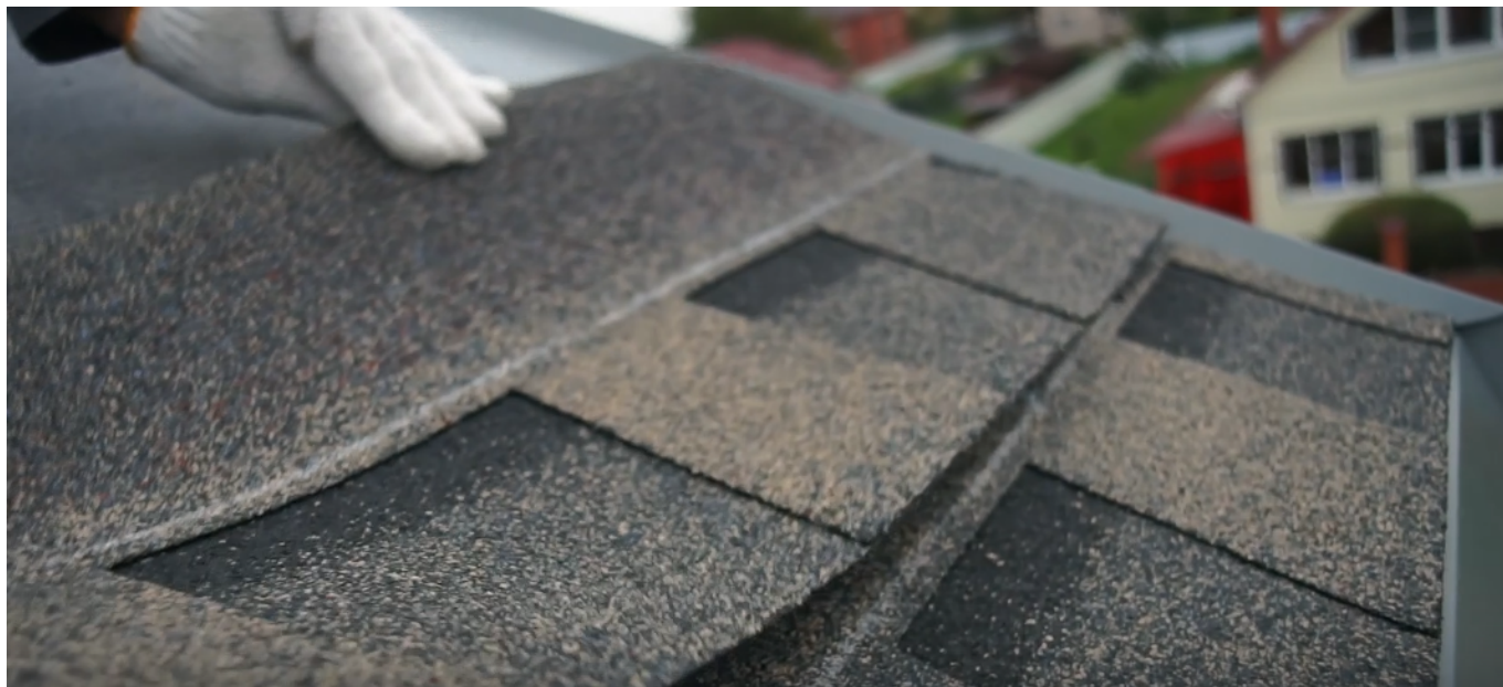
Серия 10: Устройство ендовы: «открытый» способ