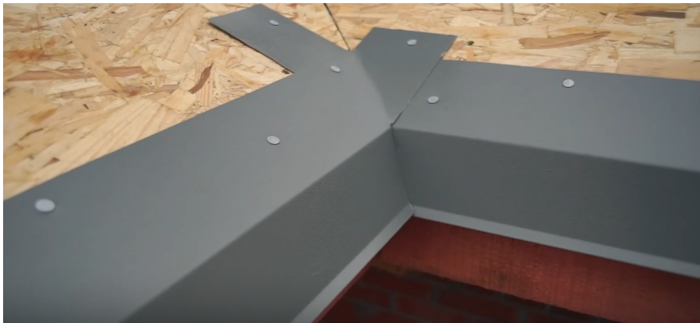
Серия 8: Монтаж подкладочного ковра и фронтовой планки