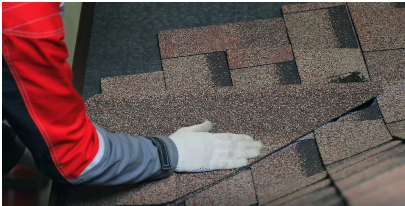
Серия 12: Примыкание кровли к стене и трубе