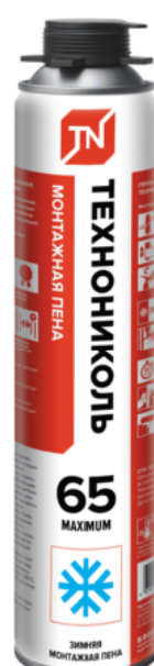
Пена монтажная профессиональная ТЕХНОНИКОЛЬ 65 MAXIMUM зимняя