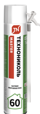
Пена ТЕХНОНИКОЛЬ MASTER 60 Бытовая