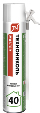
Пена ТЕХНОНИКОЛЬ MASTER 40 Бытовая