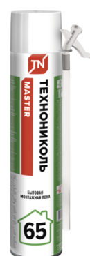
Пена ТЕХНОНИКОЛЬ MASTER 65 Бытовая