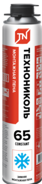
Пена монтажная профессиональная ТЕХНОНИКОЛЬ 65 CONSTANT зимняя