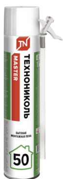
Пена ТЕХНОНИКОЛЬ MASTER 50 Бытовая