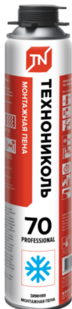
Пена монтажная ТЕХНОНИКОЛЬ 70 PROFESSIONAL зимняя

Зимняя. По сравнению со всесезонной и летней содержит больше растворителя. Это позволяет ей не замерзать в процессе полимеризации даже при температуре ниже -10°C. Например, зимние пены ТЕХНОНИКОЛЬ можно использовать в широком диапазоне: от -18°C до +30°C.