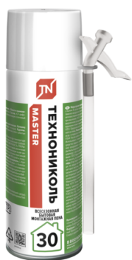
Пена ТЕХНОНИКОЛЬ MASTER 30 бытовая 520 ml

ТЕХНОНИКОЛЬ предлагает пену монтажную ТЕХНОНИКОЛЬ MASTER бытовую в нескольких вариантах. Выбор зависит от объема выхода: