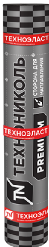
Пример битумно-полимерного рулонного материала