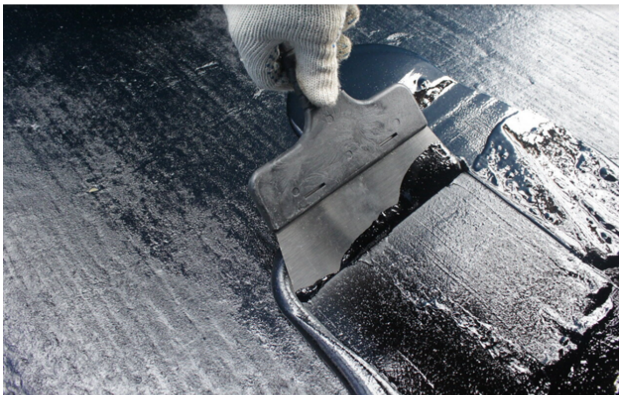
Пример мастичного материала