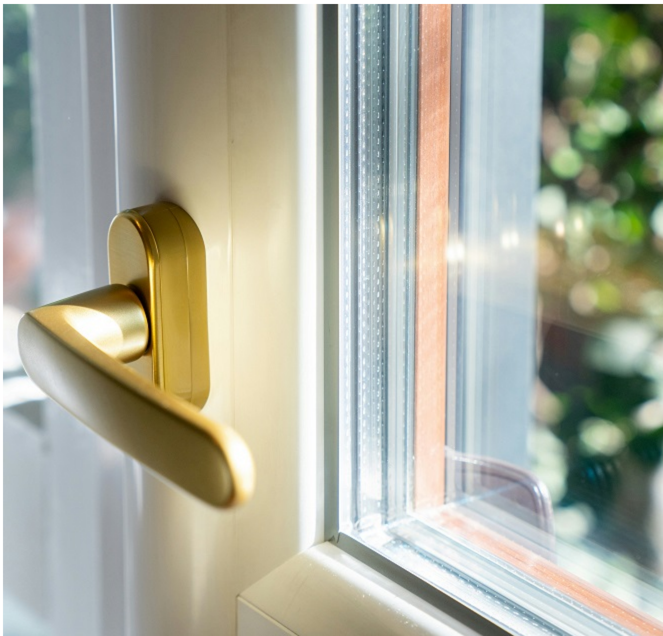
Рис. 1. Широкий профиль позволяет установить массивные стеклопакеты с повышенной защитой от шума

Многослойная структура. Профили с большим количеством внутренних перегородок эффективнее гасят шум, чем более тонкие простые конструкции (например, 3-х камерные). Чем больше камер в профиле (5 и более), тем тише будет в помещении. Воздушные прослойки и перегородки работают как дополнительные звукоизолирующие барьеры.