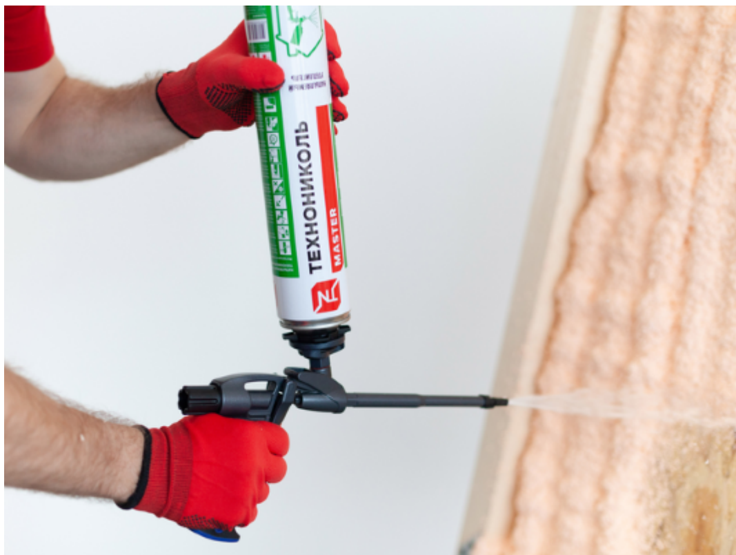
Рис. 6. Напыляемый утеплитель ТЕХНОНИКОЛЬ MASTER повышает герметичность швов, усиливает изоляцию шума

Подготовка поверхности откосов. Это включает в себя очистку от старой отделки, грязи, пыли, проверку на наличие трещин и дефектов. Все несовершенства необходимо заделать, выровнять, чтобы утеплитель лучше прилегал к поверхности.