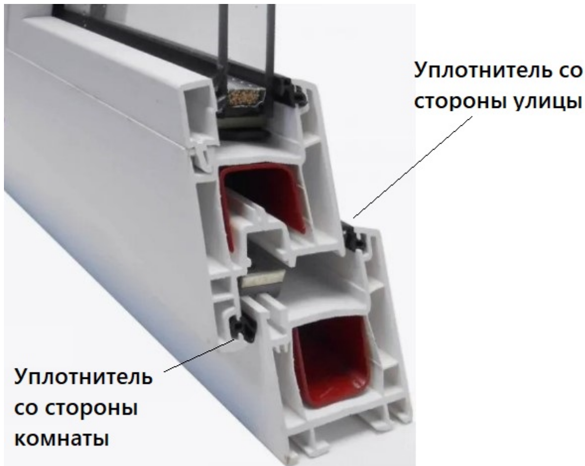
Рис. 2. Оконный уплотнитель, расположенный на прижме створки к коробке

На уплотнителе не должно быть грязи, пыли. Чтобы уплотнитель (особенно черный каучуковый) не терял упругости и эластичности, его «лепестки» необходимо обрабатывать силиконовым спреем. На поверхности уплотнителя не должно быть трещин, «ссохшихся» мест, пережимов и т.д. При необходимости уплотнитель можно легко заменить.