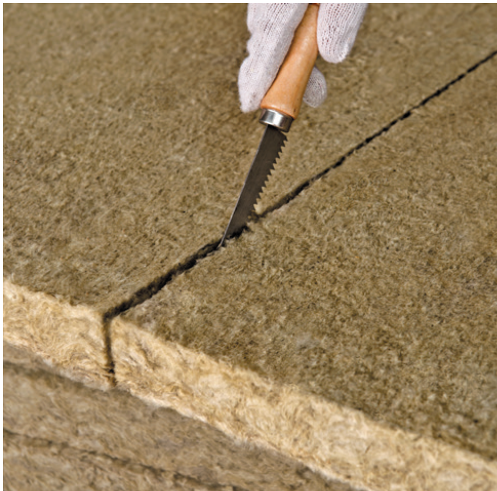
Монтаж теплоизоляции враспор между лагами: