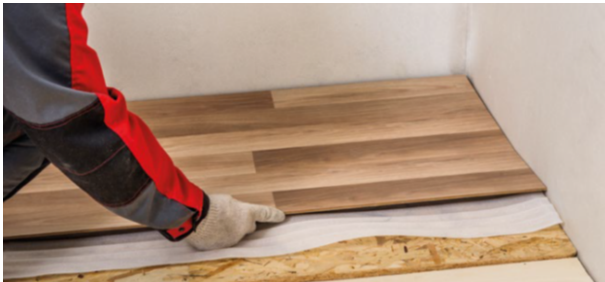
Готовый вид пола по лагам: