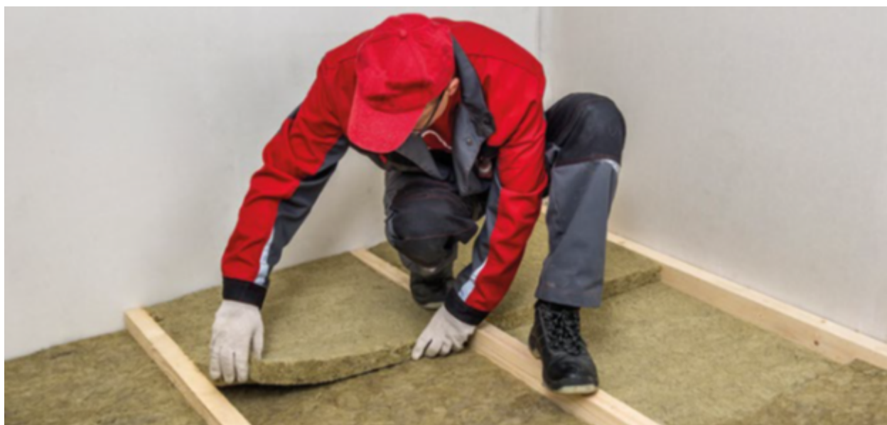
При укладке второго слоя плит необходимо соблюсти разбежку швов и уложить плиты со сдвигом относительно первого слоя.