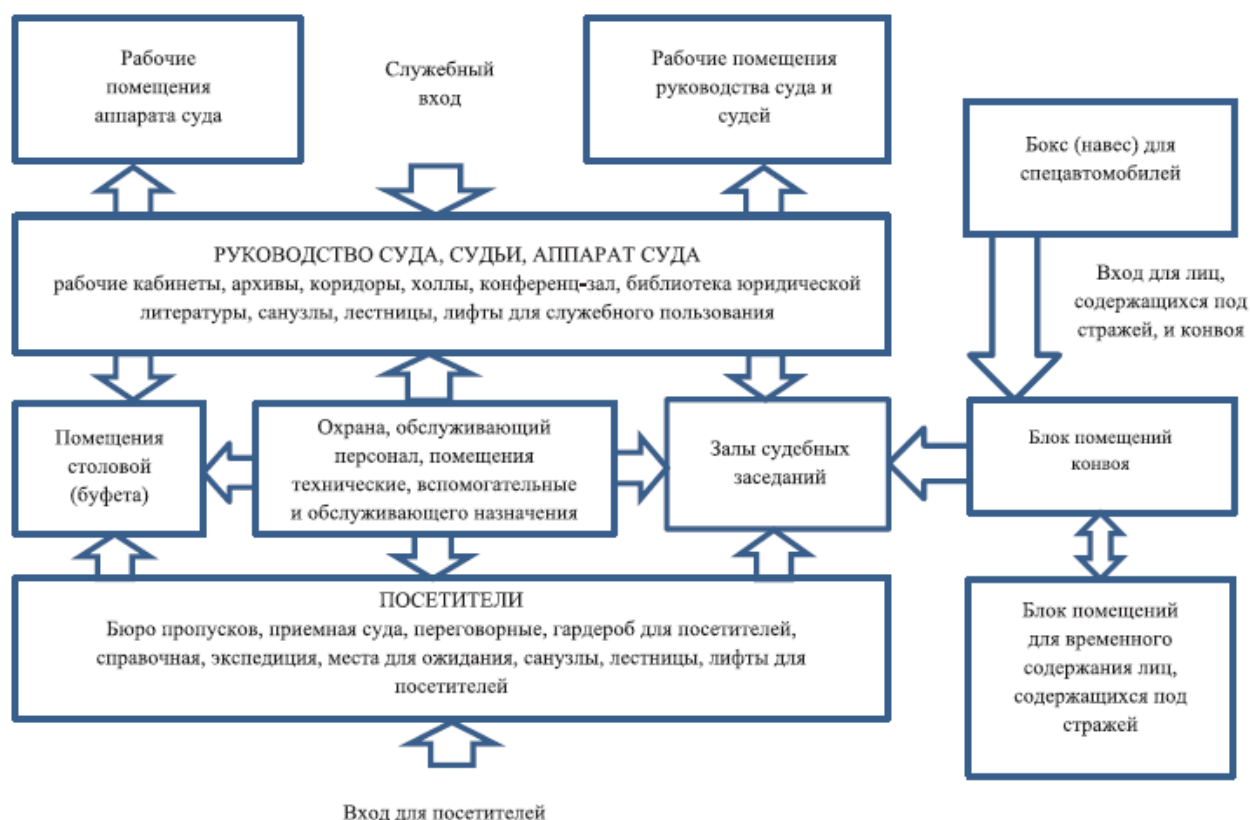
Рисунок 6.1* - Схема функциональной взаимосвязи основных групп помещений зданий судов (для арбитражных судов без блока помещений для конвоя и лиц содержащихся под стражей)