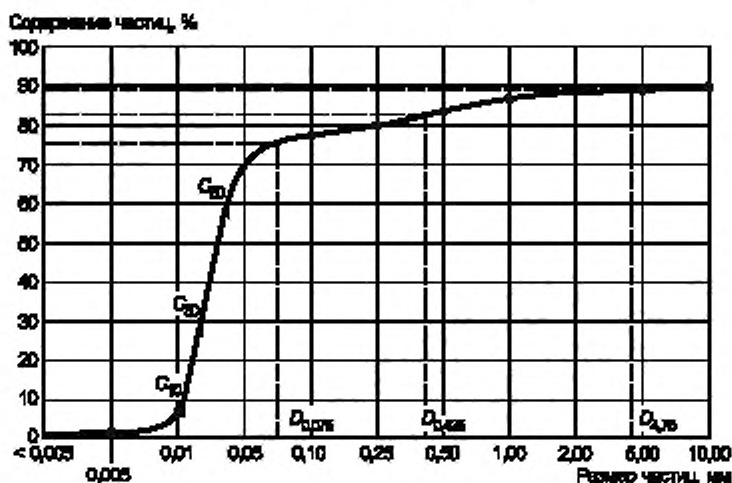
Рисунок Е.2 — Кумулятивная кривая гранулометрического состава

Символы второстепенных фракций записывают строчными буквами.